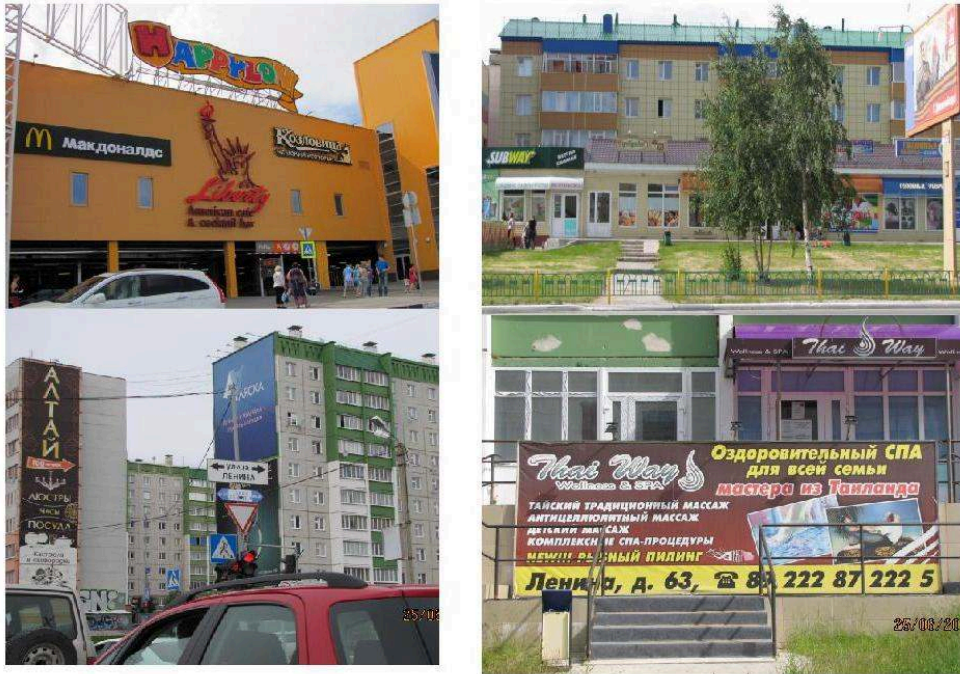
Figure 7. Emergence des paysages de consommation.

Depuis le coin haut gauche vers le coin bas droite : un centre commercial à Sourgout avec Mac Donald's ; les commerces le long de la voie piétonne, au pied des immeubles à Noïabrsk avec Subway ; un centre de massage thaï ouvert depuis peu ; des grandes affiches publicitaires à la place des peintures de Sibneft .