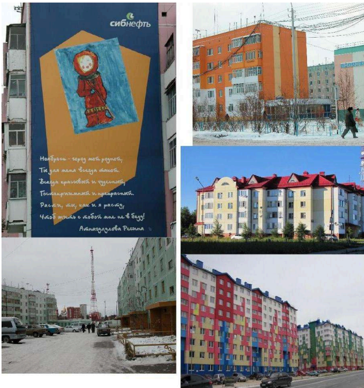
Figure 4. Arrivée de la couleur, disparition des fils électriques – vues au sol.

Noïabrsk, 63°11'N 75°27'E, pétrole et gaz, ville depuis 1982, 107 000 hab. Mouravlenko, 63°46'N 74°31'E, pétrole, ville depuis 1990, 37 000 hab. A gauche : les rares immeubles peints l'étaient par la compagnie pétrolière Sibneft, ils étaient encore visibles au début des années 2000, tout comme les innombrables fils électriques dans la ville. (2002 & 2003). A droite : la couleur est apparue à la faveur d'opérations de rénovation : en haut, à Mouravlenko en 2008, les fils électriques sont encore très présents ; au milieu : les immeubles ont été ensuite coiffés de toits colorés, et de nouvelles constructions ; en bas, à Noïabrsk en 2015 les fils électriques disparaissent.