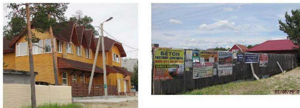
Figure 8. Emergence des espaces privés.

À gauche : Noïabrsk, la communauté fermée de Mechta à une vingtaine de kilomètre de la ville – à droite : Sourgout, quartier résidentiel fermé contigu à la ville et publicité de petites entreprises.