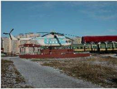
Figure 6. Emergence de nouveaux landmarks.

(figure 6). Dans tous les cas, il s'agit de construire une identité locale et stimuler l'attachement des habitants.