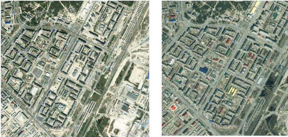
Figure 3. Urbanisme soviétique et transformations, vues du ciel.

Noïabrsk, 63°11'N 75°27'E, pétrole surtout et gaz aussi, ville depuis 1982, 109 000 hab. Zone résidentielle à l'ouest de la grande artère ; zone industrielle à l'est. On notera la présence du sol sableux partout, et des immeubles récemment coiffés de toits colorés.