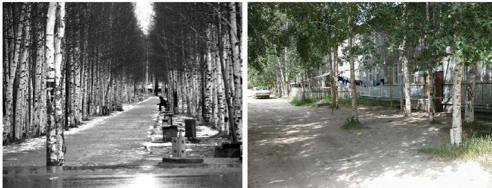
Figure 2. Des villes pionnières au cœur de la taïga.

A gauche : Nefteïougansk, 61°06'N 72°36'E, pétrole, ville depuis 1967, 102 000 hab. (hiver 2000) – A droite : Noïabrsk, 63°11'N 75°27'E, pétrole surtout et gaz aussi, ville depuis 1982, 109 000 hab. (été 1999).